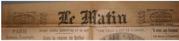
Capçalera del diari "Le Matin". París. Any 1900