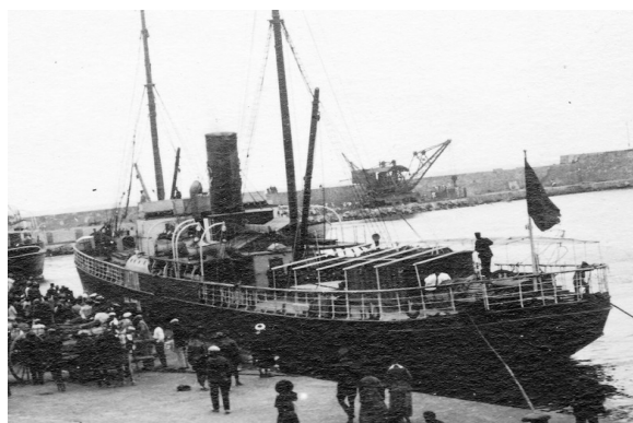
Vapor "Játiva" Any 1900

Salparen a la 1:00 de la tarda rumb a Cette, l'actual Sète, en el vapor "Játiva", pertanyent a la Compañía de Navegación Valencia, que comptava amb excel.lents condicions i era de gran tonatge, resultant un viatge per mar molt amè doncs varen poder disfrutar de les meravelloses vistes del litoral de Llevant i en passar per la Punta, a la costa d'Arenys de Mar, el vapor féu sonar la sirena i disminuï la marxa per tal que tots poguessin saludar la vil.la.