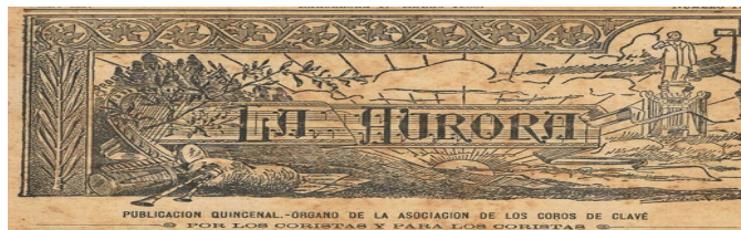
Capçalera de la Publicació quinzenal " La Aurora ". Òrgan de l'Associació dels Cors de Clavé. Any 1900

Es varen dirigir als seus respectius allotjaments, tots en molt bones condicions, per poder prendre un bany i empolainar-se amb els seus millors vestits i més tard caminant pels carrers, sota mirades d'admiració "...que hermosa resultaba la barretina en aquellos obreros que iban a hacer ostentación de su cultura..." apuntava la publicació quinzenal " La Aurora ".