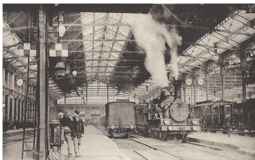
Estació de Lió, París. Any 1900

Concentrats tots a la plaça de la Constitució anaren cap a l'estació de trens escortats per considerable públic on agafaren un tren exprés de la Companyia París-Lió-Mediterrani per continuar el trajecte cap a París. Instal·lats en còmodes cotxes de tercera, reberen un tracte acurat enmig d'un ambient on hi regnava l'humor que feia desaparèixer el cansament pel llarg viatge.