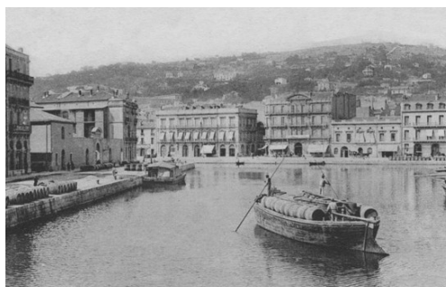
Port de Cette. Any 1900

En pondre's el sol, reunits a coberta, cantaren Al Mar i l'himne La Gratitude i conten que tot seguit el mar començà a agitar-se i degut a això alguns començaren a marejar-se sense que el metge de l'expedició hi pogués fer massa, però malgrat tot l'escena no deixà de ser distreta i jocosa gràcies a l'ocurrència d'un dels expedicionaris que per curar-los els feia estirar en un divan i tot seguit els passava una senyera dels peus fins el cap tres vegades seguides mentre pronunciava la paraula "Tabahú" convidant-els tot seguit a prendre una copa de rom. El remei per descomptat no els feia passar el mareig però sens dubte fou un espectacle divertit.