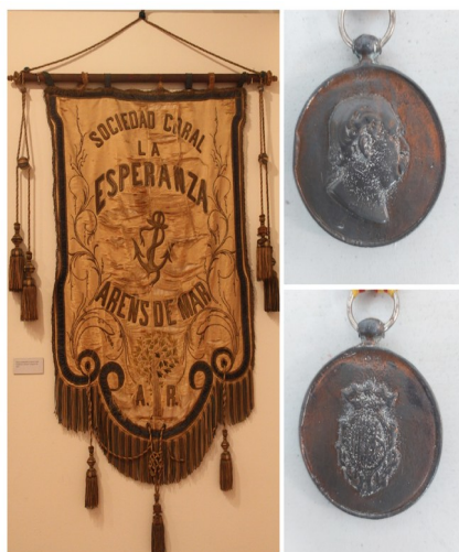
Estandard i Medalla S.C." L'Esperança" Any 1900