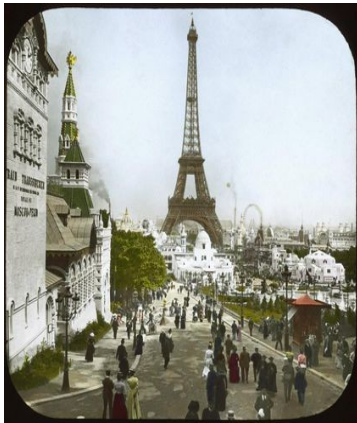
París durant l'Exposició Universal de 1900