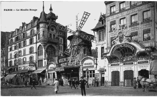
Moulin Rouge. Any 1900

El gran concert al “ Moulin Rouge ” feu el ple complet i la gran concurrència aplaudí les notes de Gloria a España , Las Galas del Cinca , Les Flors de Maig , Els Pescadors i ovacionà l’indispensable himne La Marsellesa , provocant que un grup de mitja dotzena de espectadors, amb veu apagada, demanessin que interpretaren Els Segadors però, tal com era d’esperar, no foren