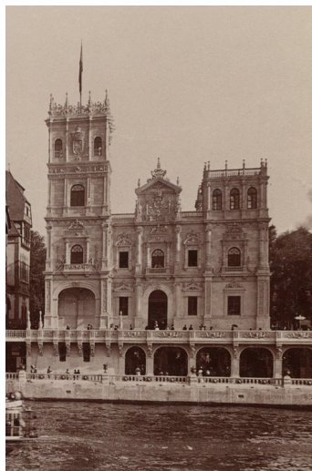
Pavelló d'Espanya. París 1900

l'escriptora i cronista Doña Emilia Pardo Bazán com: ".....la ciutat mare, el cervell del món, on les generacions acuden a apagar la seva set de idees....." .